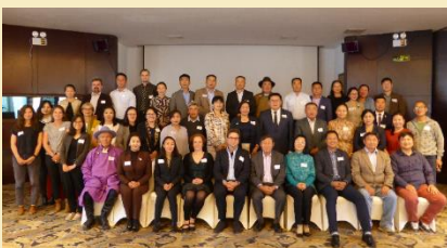
Талуудын уулзалт, 2019 оны 8-р сарын 28 Улаанбаатар хот

2019 онд бид орон нутгийн шийдвэр гаргагчид, малчид зэрэг олон талуудын уулзалт Улаанбаатарт зохион байгуулсан. Бид төслийн үйл явц, хүлээгдэж буй үр дүнг холбогдох талуудад танилцуулах, мөн шаардлагатай бодлого, ирээдүйн чиглэлийг тодорхойлохыг зорьсон. Уулзалтад оролцож төслийн цаашдын үйл ажиллагаанд чухал хувь нэмэр оруулсан нийт 52 төлөөлөгчидэд баярлалаа.